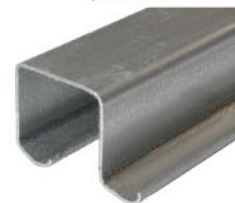
Ходовой профиль арт. 29-068