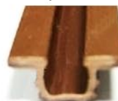
Профиль направляющий врезной арт. 29-069