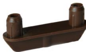
Направляющая деталь арт. 29-070