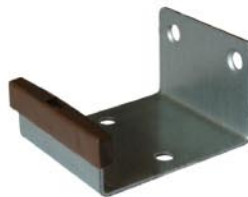
Ходовой профиль арт. 29-068