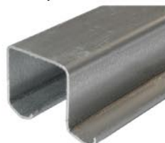
Ходовой профиль арт. 29-068